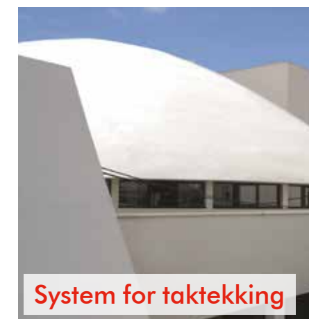
System for taktekking

Broer, infrastruktur, drikkevanns- og avløpsindustri, balkonger, terrasser, kjellere og fundamenter.