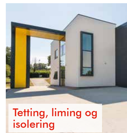
Tetting, liming og isolering

Tremco CPG Europe-merkene dekker et bredt spekter av bygg- og anleggsbehov og tilbyr en unik kombinasjon av avanserte tjenester, support og systemer - noe man sjelden finner under ett tak.